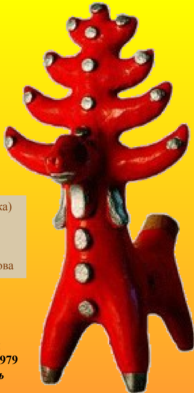
Баба (игрушка) Мастер Студницкая Хлуднево, Калуга, 1979 Глина, роспись