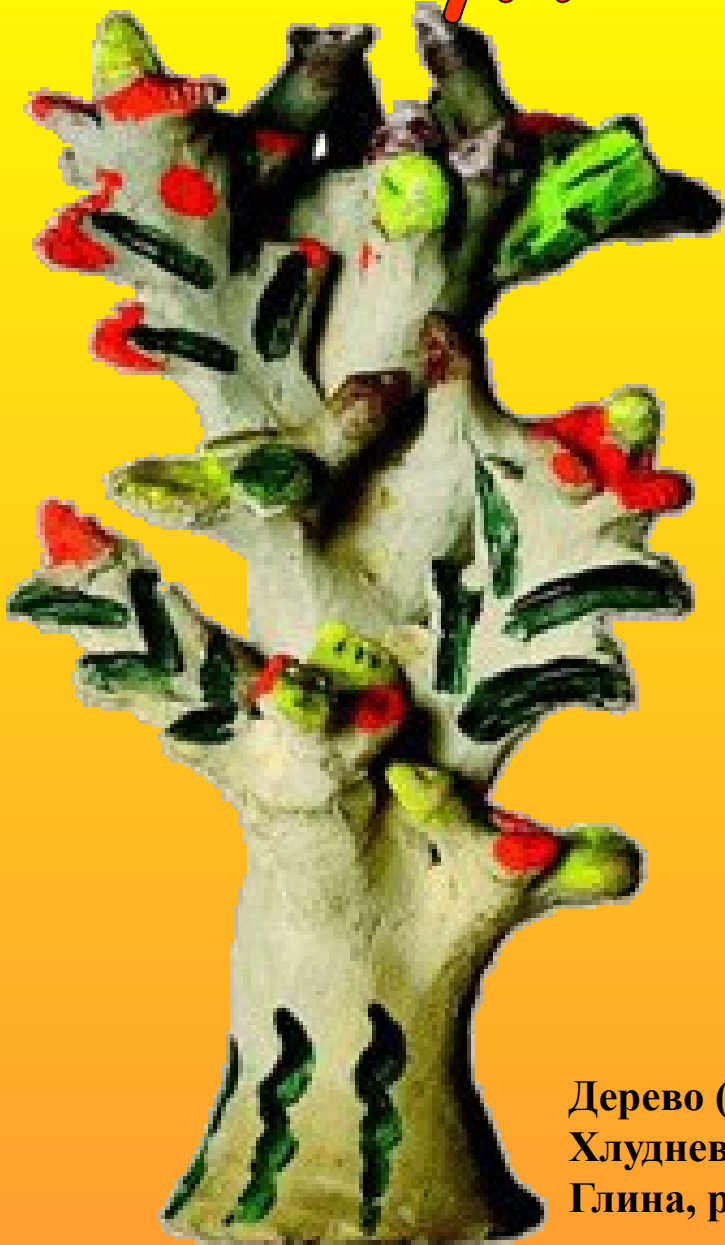
Дерево (игрушка) Хлуднево, Калуга, 1981 Глина, роспись.