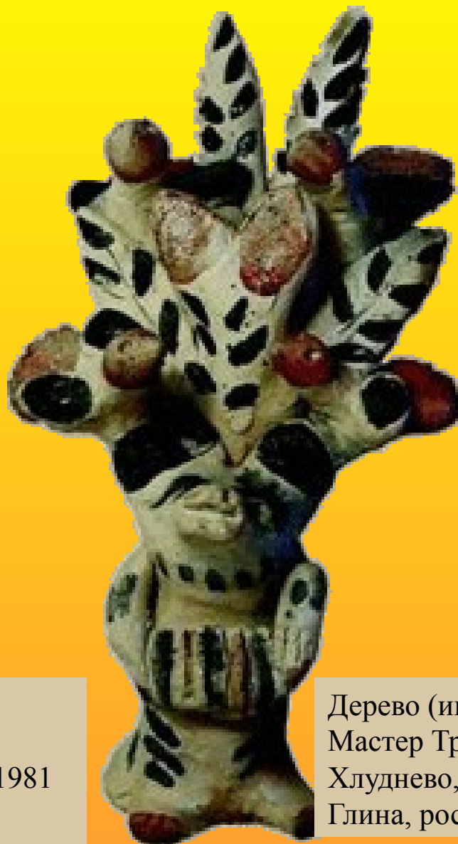
Дерево (игрушка) Мастер Трифонова Хлуднево, Калуга, 1981 Глина, роспись