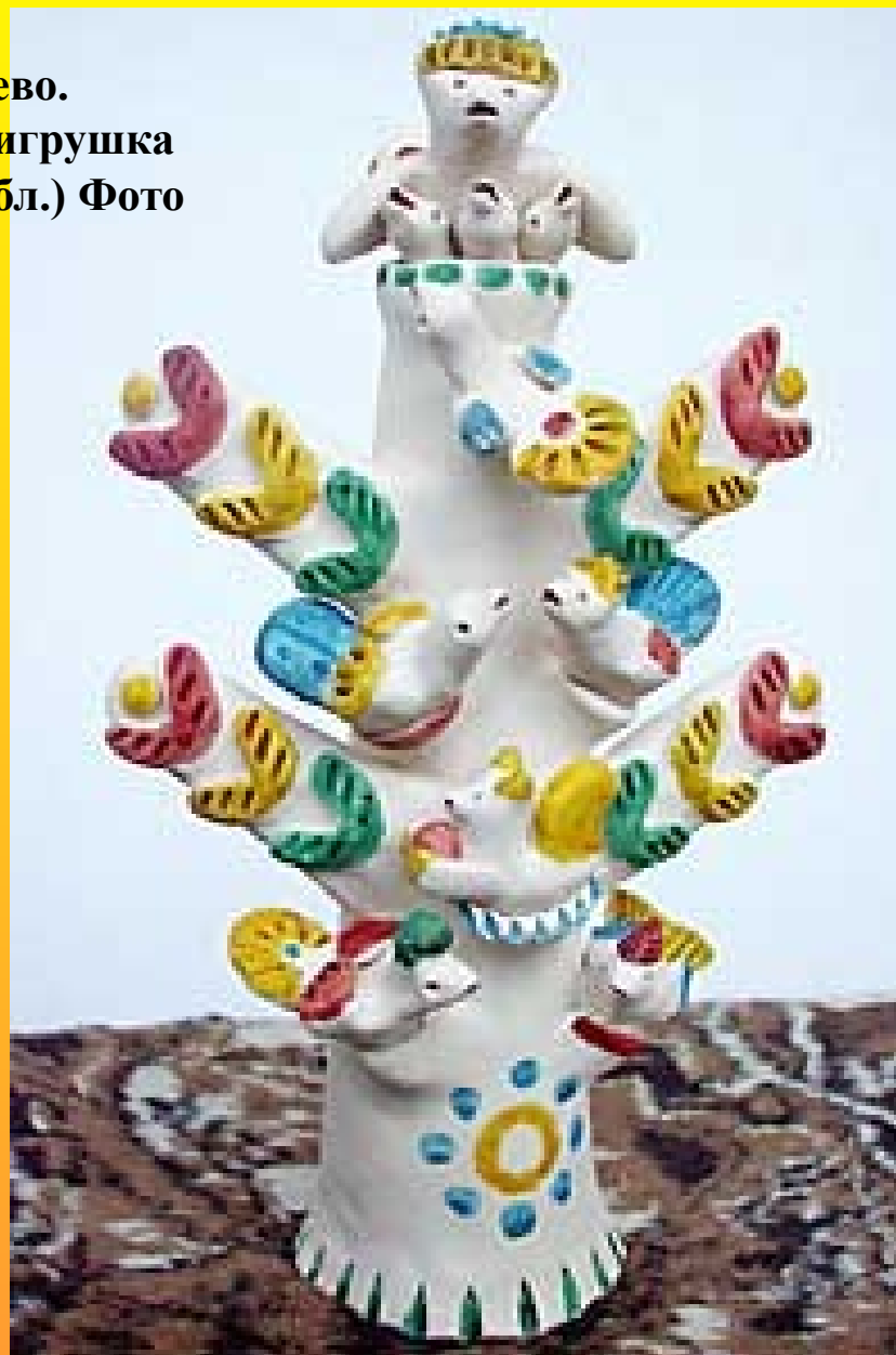
Глиняное дерево. Хлудневская игрушка (Калужская обл.)