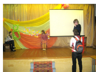
После спектакля лицесты подходят к юным актрисам со словами одобрения и восхищения.